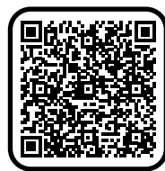
Offres de formation Maritime